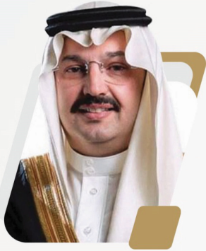
صاحب السمو الملكي الأمير الأمير تركي بن طلال بن عبدالعزيز آل سعود