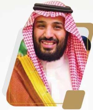
صاحب السمو الملكي الأمير محمد بن سلمان بن عبدالعزيز آل سعود