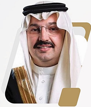
صاحب السمو الملكي السفير الأمين محمد بن طلال بن عبدالعزيز آل سعود