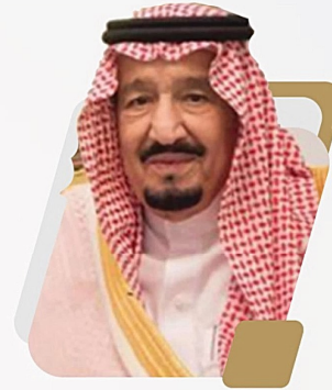
صاحب السمو الملكي السفير الملك فيصل بن عبدالعزيز آل سعود