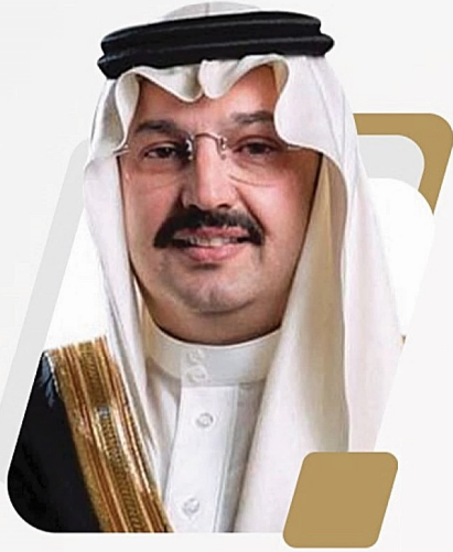
« صاحب السمو الملكي الأمير الأمير تركي بن طلال بن عبدالعزيز آل سعود »