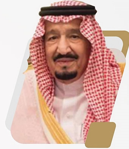
« خادم الحرمين الشريفين الملك سلمان بن عبدالعزيز آل سعود »